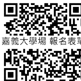
嘉義大學場 報名表單