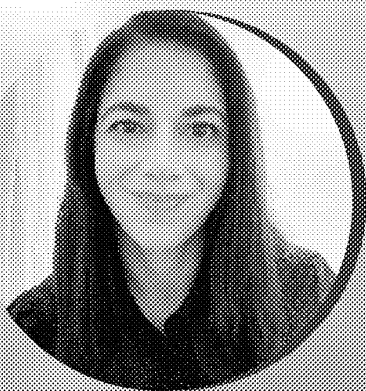
Presented by: Danielle Sclafani